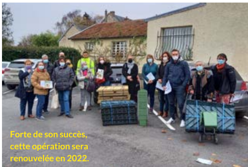
Forte de son succès, cette opération sera renouvelée en 2022.

Mêlant théorie et pratique, cet atelier gratuit a permis à 20 Tardenevillien(ne)s de comprendre le fonctionnement d'un composteur, son entretien et de donner à chacun une base solide pour bien utiliser, dans le jardin ou les plantations, le compost obtenu.